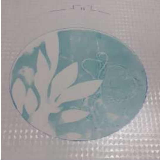
النسخة الطباعية التى فوجيء فيها الباحث بانسداد النسيج الحريرى بعد سحب الحبر الطباعى عليها

ولكن فى محاولات متعددة واصرار من الباحث على نجاح تجربة الطباعة توصل الباحث إلى الإستعانة بأحد منظفات ومذيبات المواد الدهنية ( سيتريس Cetris ) والذى يستخدم فى الأغراض المنزلية للقضاء على آثار الدهون العالقه على الجدران والأسطح فى المطابخ والذى نجح بالفعل فى التغلب على انسداد النسيج الحريرى وإعادة مظهره كما كان دون أى تلف فيه او تغيير فى مظهره ليعاود الباحث العمل عليه بنفس الكفاءة التى بدأ بها تجربة الطباعة على تلك النسيج الحريرى ، وهو على قناعة تامة بضرورة ان يكون الفنان فى حالة اصرار وتحدى مستمر فى مواجهة كل الظروف والعقبات لتخطى كل الصعاب التى يمكن ان تقف فى طريقة ومسيرته الفنية . لذا فقد أشار الباحث مسبقاً " بضرورة غسل النسيج الحريرى بإستمرار بالماء بعد كل مرحلة من مراحل العزل والطباعة لضمان بقاء النسيج الحريرى نظيف دون ان يحدث له أى انسداد فى فتحات النسيج الطباعى المشدود على طوق التطريز .