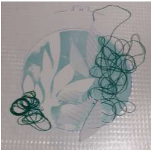
النسخه الطباعية وطبيعة العزل عليها بالاستنسل الورقى والخيوط لإستكمال عمليات الطباعة عليها بالاحبار الطباعية بعد التغلب على مشكلة انسداد النسيج الحريرى المشدود على طوق التطريز