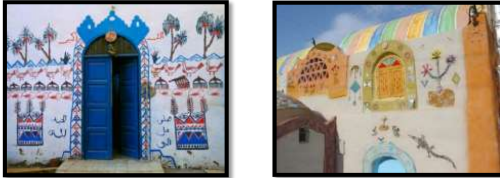
شكل رقم (7)

ولأن منطقة النوبة تميزت بالعديد من النواحي الجمالية والفنية التي تأثرت بالبيئة المحيطة وأفرزت إبداعات في فنونها، فالموروث الضخم للفن النوبي الذي هيأت له العوامل الجغرافية والبيئية والاجتماعية كان بمثابة التربة الصالحة لتفجير طاقته الإبداعية، فأفكار الفنان مستوحاة من معتقدات وعادات وقيم اجتماعية فكانت تلك الرموز بمثابة الطريق الذي سار على نهجه الفنان في رسومه الجدارية وما هو إلا تعبيراً عن كل ذلك لكل الخطوط التقليدية التي ألفها المجتمع . وأيضاً أقام عليها المعايير التي شكل من خلالها مضامينه الفنية والجمالية والإبداعية والفلسفية برؤيته الخاصة 18 . شكل رقم (7)