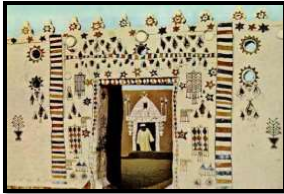
شكل رقم (10)

فيبحث دائما عن مظاهر الجمال ويقوم بترجمة الرموز التي تتطلب إدراكاً ذهنياً ويقوم بتقديمها إلى المتلقي وكل ذلك بما يتلائم مع بيئة كل مكان. ولا ننسى أن التكنولوجيا المعاصرة ساعدت في تطور الفنون التشكيلية بوجه عام في جميع تخصصاتها وأسهمت بشكل إيجابي في أداء الفنانين، مع ضرورة الانتباه ألا تسبب المستحدثات التكنولوجية في تجاهل التراث والموروث الثقافي للشعوب. وما يتفرد به من مفردات تشكيلية غاية في الثراء والتأصل.