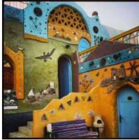
شكل رقم (2)

أحد البيوت في منطقة النوبة يوضح رسومًا بيها أيقونات ورموز تراثية