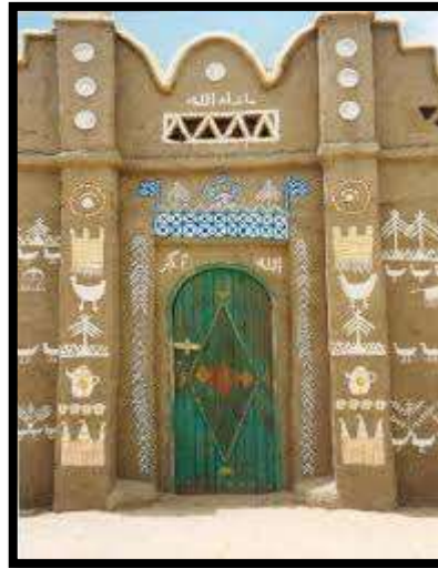
شكل رقم (9)

إن الإنسان النوبي يميل إلى التفاؤل والاستبشار، وهو عاشق للفن، فكل شيء في حياته مرتبط بصيغٍ جمالية فعينه مجبولة على جمال الطبيعة وحياته مبنية على تقاليد أصيلة، وينعكس ذلك في الألوان المزدهرة والمتناسقة، والرسوم والزخارف الجذابة، ولا يخلو فُهم من رموز تختلف معانيها ودلالاتها. 21 لذا فإن للرسوم الجدارية في بلاد النوبة قيمة خاصة نابعة من أصالتها، فهي نسيج من وجدان الحضارات المختلفة التي مرت عليها، ولم يستطع الزمان أن يذهب بأصالتها، فهي وجدان الشعوب وثوراته للأجيال. وتتعدد أساليب قراءة الفنون الجدارية من الناحية الإبداعية؛ لأن الرسوم الجدارية في بلاد النوبة نراها قد جمعت بين الواقعية والرمزية التجريدية ولكنها نادرة في المعاصرة. وعلى الصعيد الآخر تطرقنا من خلال النقاط التحليلية لبعض النماذج المنفذة من قبل الفنانين النوبيين أن تلك الأعمال قد اشتملت على الرمزية التجريدية في التصميم لبعض لمعظم الرسوم التي مثلت قيمة فردية من المجتمع النوبي. وذلك لما تجمله تلك الرموز والأشكال من لغة يقوم باستخدامها الفنان للتعبير عن أحاسيسه وانفعالاته ومعتقداته، على أن يكون الرمز محملاً بقيم المجتمع الثقافية والفكرية. 22