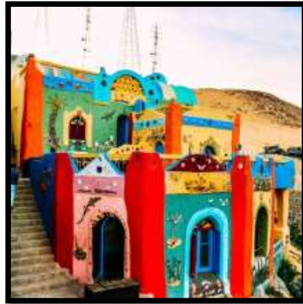
شكل رقم (12)

ومع تطور فن التصوير الجداري وتطور الخامات وظهور التكنولوجيا المعاصرة في الخامات والأدوات وأيضاً دمج العديد من التقنيات والخامات مع بعضها البعض. 29 (شكل رقم 12) فالخامات التشكيلية تأخذ من التاريخ والانطباعات لتتحول إلى لغة من الألوان والخطوط والكتل والإيقاعات. لأن الخامة في العمل الجداري المرتبط ارتباطاً وثيقاً بالعمارة الفنية دوماً أنه فعل وممارسة إبداعية. والخامة في التصوير الجداري تعتمد دائماً على إبداع وابتكار الفنان في توظيفه لها لما تتسم به من القدرة على التجريب سواء أكانت طبيعية أو مصنعة، فالخامات تعطي جمالاً للعمل الجداري كما أن توليف الخامات يختلف من عمل فني إلى آخر حسب نوعية كل خامة ونوعية العمل والسطح المنفذ عليه. لذا لا بد أن تتصف بالتكامل وحبكة التكوين الذي يحكم عناصر التصميم الجداري ويعطى له فرديته المتميزة من ثراء الملامس.