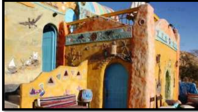
شكل رقم (8)

وقد استخدمت فيه زخارف الصليبان المحفورة وزهور ودوائر وزخارف مضفرة ومنكسرة وأغصان العنب وعناقيده بأسلوب محور. 19