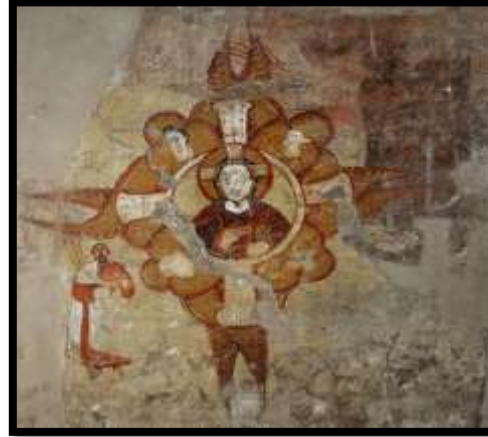
شكل رقم (6)

ومن ذلك التعريف استنباط أهمية الخامة وتطبيقها من خلال الوحدات التصميمية في تلك الأعمال الفنية الجدارية، يكمن تأثيرها في خصائصها الفيزيائية، وأيضًا في رؤيتها الفلسفية للأشياء من حيث الطريقة في اختيار تلك المواد التي يتلاعب الفنان برؤيتها التشكيلية لخلق وحدة تصميمية مستحدثة بفكر معاصر من خلال رسالته الفنية التي يبعث بها إلى المتلقى في تلك المناطق. وإيجاد مرتدة ديناميكية من المعرفة والخبرات والتعلم والبيئات التي تعيش في ذاكرة المصور الجداري. حيث يكون لها معان مجازية ورمزية تؤثر على الفكرة في التصميم. 16 وإذا ما عدنا إلى الوراثة تاريخيا سنجد أن القصص المصورة التي كانت تعبر عن ظهور المسيحية هي ما كانت غالبية على جدران الكتدرائيات في بلاد النوبة، حيث ابتعدت عن التجريد والبساطة في التصميم. فكانت عبارة عن صور لأشخاص ورموز أمثال أعمال (الافريسك) في كتدرائية فرس. شكل رقم (6) حيث سيطرت المسيحية على بلاد النوبة حقبة ما تقرب من الخمس قرون، إلى أن تطور الأمر بعد ذلك، بعد دخول الإسلام حتى العصر الحديث فبدت تأخذ صورًا أخرى ألا وهي الأشكال المجردة والرموز التعبيرية ذات الموروث الثقافي والتاريخي وأيضًا الشعبي. 17