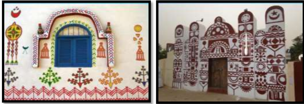
شكل رقم (5)