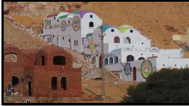
شكل رقم (1)

للهوية النوبية أداه للتجريب الفني ومصدر لإلهام العديد من مصممي التصوير الجداري، فإذا ما رجعنا إلى تلك الهوية نجد مسارًا مفتوحًا للمصمم في اختيار وسائل وطرق تشكيلية معاصرة مختلفة لرؤى التصميم في وقتنا الحالي، لكي يجني من خلالها التصوير الجداري تحقيق فكر إبداعي خلاق. 3 شكل رقم (1)