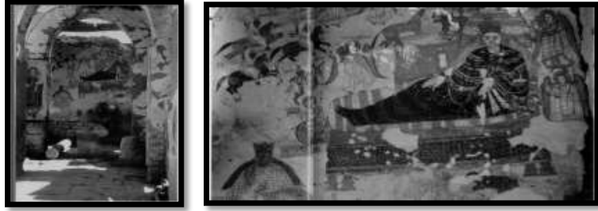
شكل رقم (4)