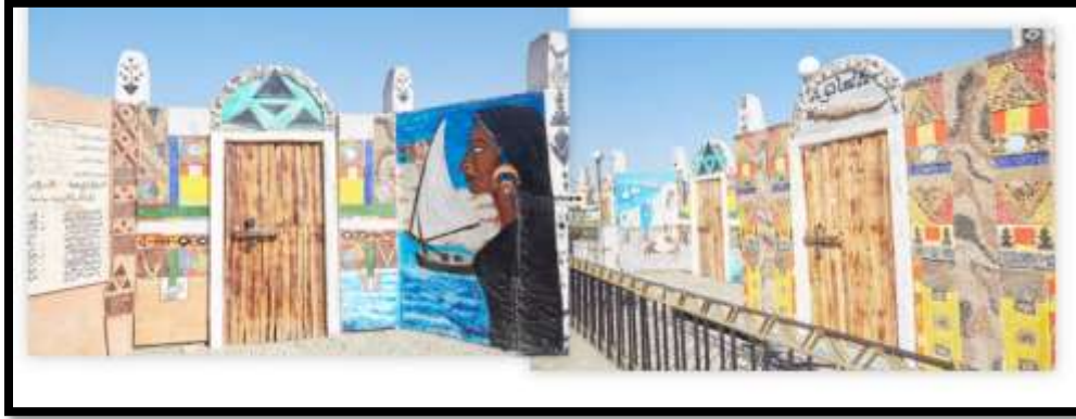
شكل رقم (11)

يوضح نماذج لعمل جداري في بلاد النوبة استخدمت خامات طبيعية، مصنعة مع الأصباغ الملونة